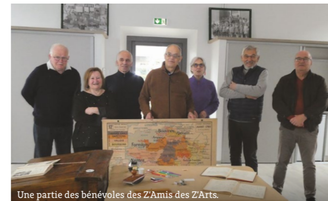
Une partie des bénévoles des Z'Amis des Z'Arts.

Merci aux Z'Amis des Z'Arts et à tous les participants !