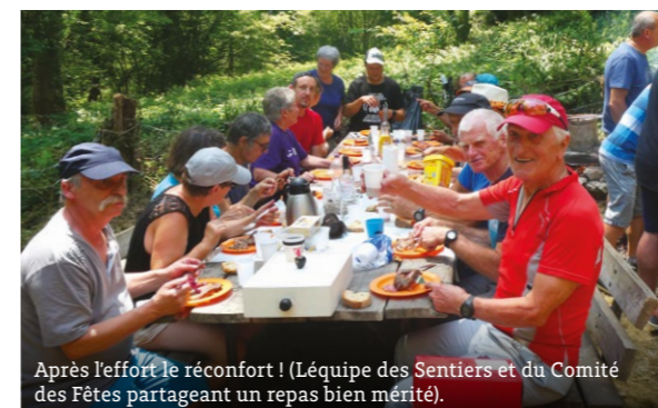
Après l'effort le réconfort ! (L'équipe des Sentiers et du Comité des Fêtes partageant un repas bien mérité).

Plan des sentiers de St Alban-Leyse disponible à l'accueil de la mairie.