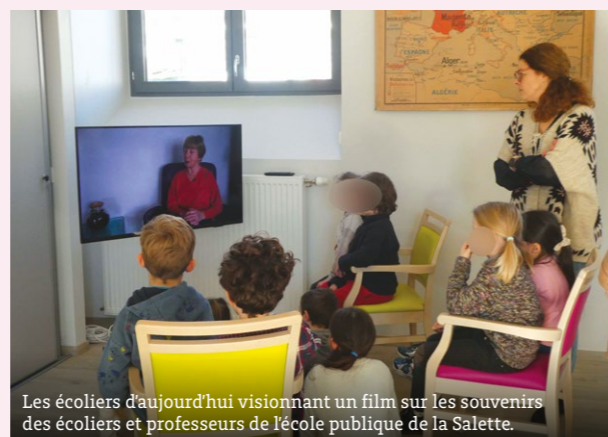
Les écoliers d'aujourd'hui visionnant un film sur les souvenirs des écoliers et professeurs de l'école publique de la Salette.

« Très bonne idée d'avoir conservé ce patrimoine et merci aux bénévoles qui permettent de faire vivre ce lieu. »